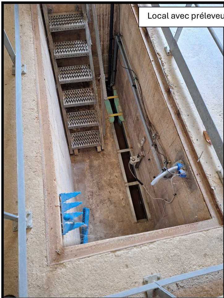
Local avec préleveur et Canal Venturi