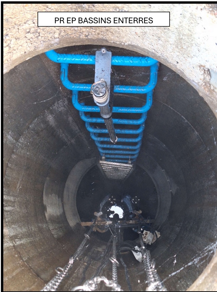
PR EP BASSINS ENTERRES