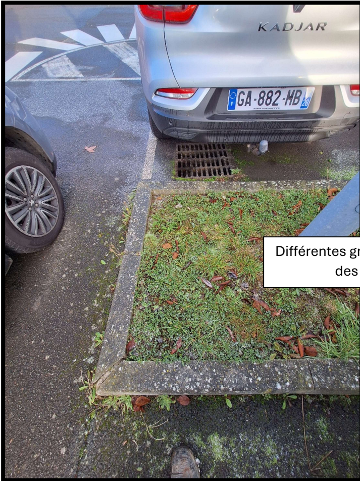
Différentes grilles EP à l'extérieur des bâtiments