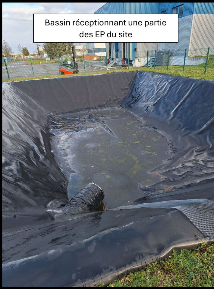
Bassin réceptionnant une partie des EP du site