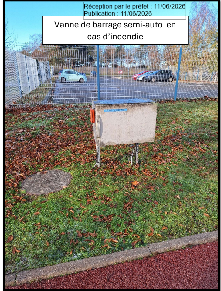
Vanne de barrage semi-auto en cas d'incendie