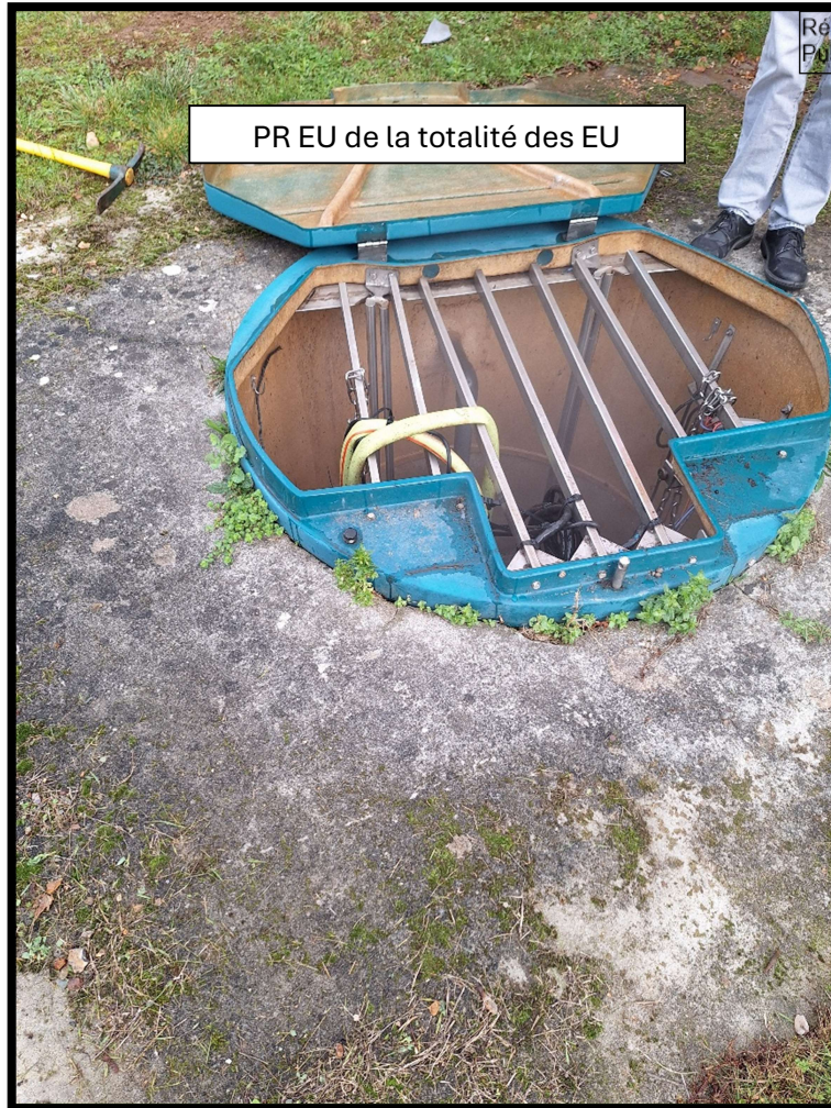
PR EU de la totalité des EU