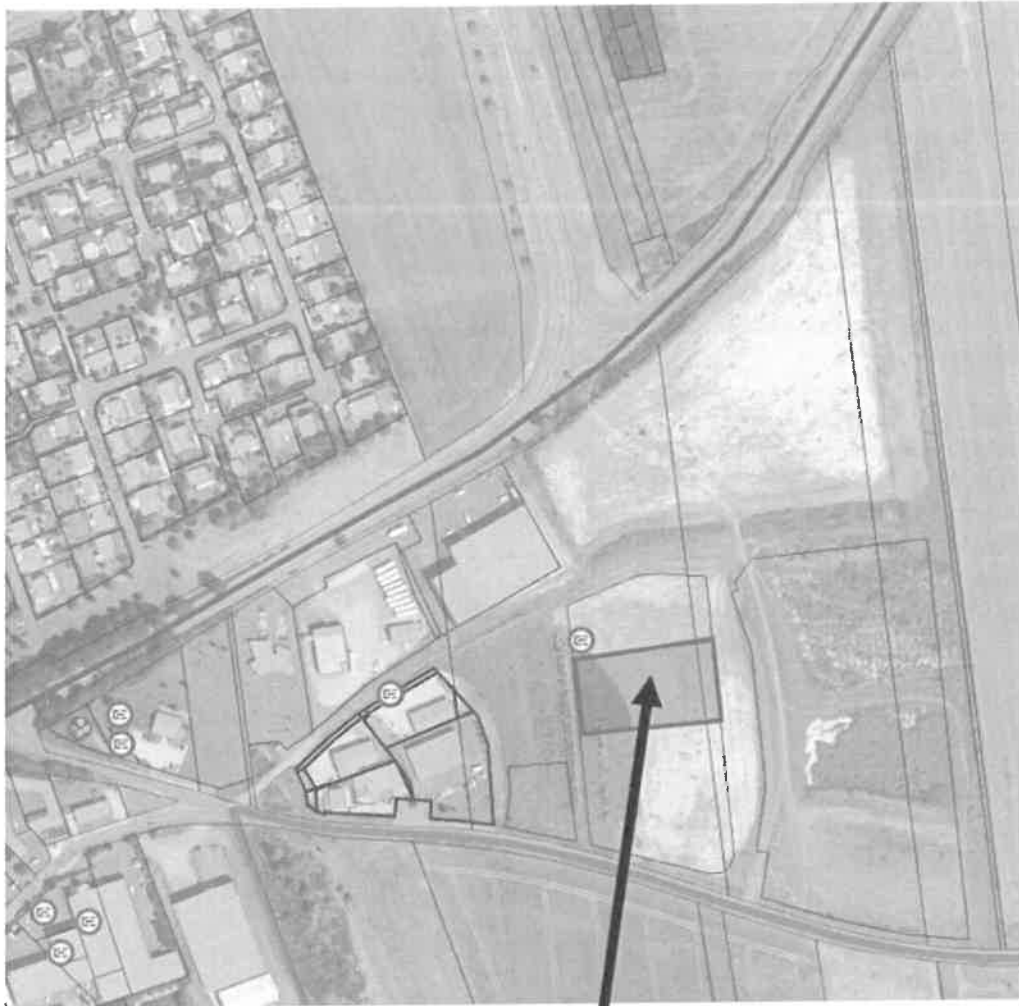
Lot n°14 Terrain d'environ 3 486 m 2

VU le 9 e de la délibération n°2021-75 du 12 avril 2021 portant délégation du conseil au bureau ; VU la délibération n° CC2023-117 du conseil communautaire du 22 mai 2023 ; VU l'avis de France Domaine du 31 octobre 2023.