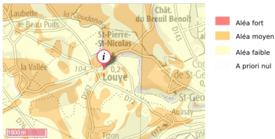
L'aléa retrait-gonflement des argiles à Louye

La commune de Louye est soumise à un aléa retrait et gonflement des sols argileux allant de faible à moyen. On constate que les boisements et la majorité du village sont concernés par cet aléa moyen. Des dispositions constructives, notamment en termes de profondeur minimale de fondation, doivent être prises lors de l'édification de nouvelles constructions dans ces zones soumises à cet aléa retrait-gonflement des argiles. Une vigilance sera de mise concernant l'urbanisation de ces secteurs afin de limiter la population exposée à ce risque. Le reste du territoire est soumis à un aléa qualifié de faible. Cela ne représente donc pas un risque immédiat pour la population.