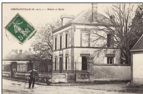
Figure 1: La Grande rue Mairie et école de Germainville