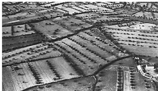
Le bocage agroforestier dans le Perche de l'Eure-et-Loir, près de Nogent-le-Rotrou en 1950

06 35 54 24 99 agroforesterie.centre@gmail.com